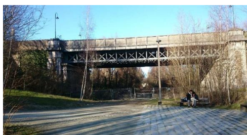
Pont Clesse (gauche) et Pont Demeer (droite) – photos extraites du dossier de demande

La CRMS encourage la restauration des deux ponts qui ont été relativement bien entretenus et ne nécessitent pas d'interventions lourdes au niveau de leurs structures. Elle émet un avis favorable sur la demande tout en formulant quelques remarques et recommandations sur certains aspects du projet: