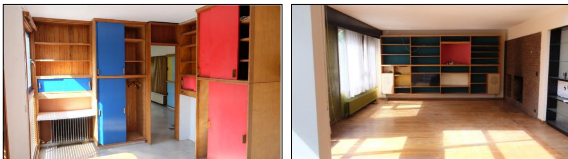
Mobilier fixe conçu par Van der Meeren, photos jointes à la demande de permis d'urbanisme introduite en 2019

La CRMS est favorable à la restauration et la remise en place d'une partie significative du mobilier des 'chambres' d'enfants. Il s'agit de 3 des 4 ensembles d'origine classés, le 4 ème ensemble sera restauré ultérieurement et stocké in situ. Le dossier mentionne l'intention de restaurer d'autres éléments non classés comme les armoires à deux caissons et portes coulissantes bleue / jaune. La CRMS s'en réjouit.