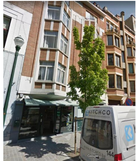
Vue du bien et de la nouvelle devanture en 2014.