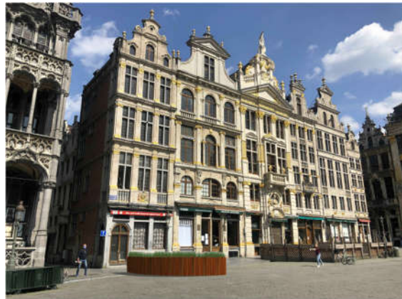
A g. : situation de fait, et à dr. : situation projetée (extr. de la demande de permis)

Afin de régulariser la situation, la demande porte sur les points suivants :