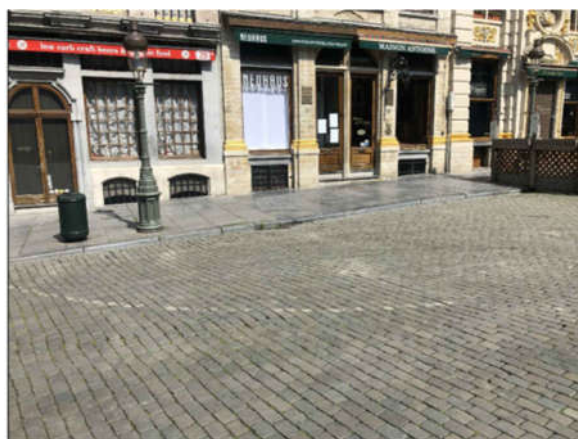
Situation de droit (extr. de la demande de permis) avec le tracé arrondi (permettant aux camions des services d'incendie de manœuvrer)

Les gérants de la « Brasserie 28 » souhaitent installer une terrasse devant l'établissement, à l'instar de nombreux autres voisins de la Grand-Place. Les travaux ont déjà été réalisés sans permis préalable et un PV d'infraction a été dressé le 15/06/2020 (la terrasse a été en partie démontée).