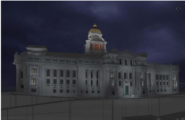
Simulatie nachtverlichting hoofdgevel Poelaertplein – beeld uit het aanvraagdossier

- de architectuur (diepte en ritme) en de hiërarchie van het gebouw worden leesbaar gemaakt. De centrale gevelpartijen en hoekgevels worden iets sterker verlicht zodat het silhouet van het gebouw zich aftekent. Door bepaalde interieurs en binnenruimtes eveneens te verlichten zal een bewoonde indruk ontstaan (met name tijdens de avonduren).