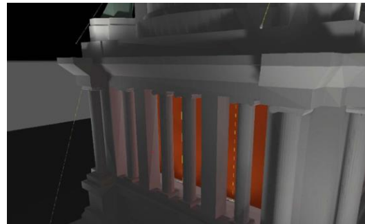
Verlichting van de ronde en vierkante tamboer – beelden uit het aanvraagdossier

- het aanlichten van de gevels met armaturen op vrijstaande masten is positief en beperkt de impact van de installatie op het gebouw. Er dient nog verder te worden bepaald waar die masten exact ingeplant zullen worden en of het eventueel ook mogelijk is deze buiten het eigenlijke domein van het Justitiepaleis te plaatsen. Deze onderhandelingen zijn nog aan de gang.