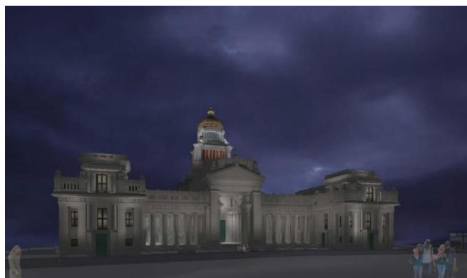
Simulatie avondverlichting hoofdgevel Poelaertplein – beeld uit het aanvraagdossier

- Naar boven toe (toren) neemt het lichtniveau wat toe. Hierdoor wordt aansluiting gezocht bij de historische situatie en wordt de functie van de toren als baken in het stadslandschap benadrukt. Ook de centrale portiek van de hoofdgevel wordt vanuit dit oogpunt iets meer uitgelicht.