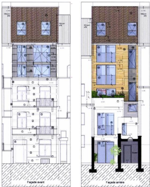
Élévation projetée en façade avant. Image tirée du dossier