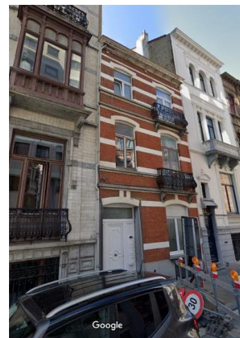
Ci-contre : vue de l'immeuble.

Le bien est une maison unifamiliale de composition modeste (R+2). Sa façade est polychrome et composée de matériaux traditionnels de qualité : revêtement en briques, bandeaux clairs, soubassement en pierre bleue, et garde-corps en fer forgé.