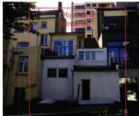
Vue sur la façade arrière actuelle. Image tirée du dossier.