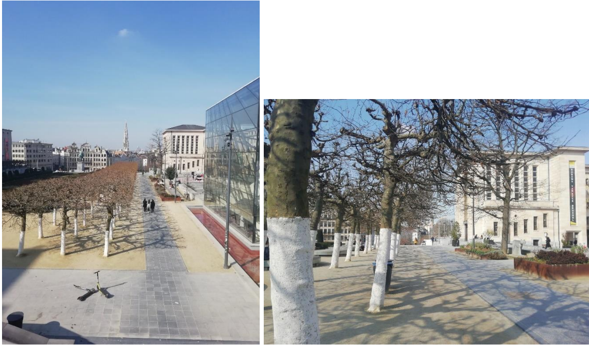
Lengteas van de tuin ter hoogte van het Dynastiepaleis