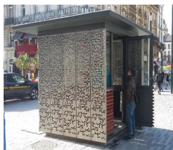
Le modèle proposé installé sur le Boulevard Anspach