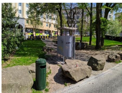
Vue de l'urinoir actuel Square de la Putterie

Pour mémoire, lors de sa séance du 23/09/2020, la CRMS avait émis un avis sur le 'Plan Toilettes' par la Ville de Bruxelles. Dans ce plan, le remplacement de l'urinoir du Square de la Putterie par un édicule sanitaire, visée par la présente demande, était prévu. L'urinoir installé au Square de la Putterie sera remplacé par un édicule sanitaire rectangulaire en béton habillé de tôle en inox. Ce modèle (Sac Evo 1H) a aussi été installé sur la Place de Brouckère et sur le Boulevard Anspach et sera aussi le modèle utilisé pour les nouvelles toilettes publique de STIB à hauteur du boulevard Adolphe Max.