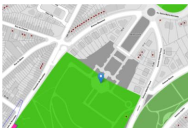
Localisation Brugs de la future guinguette

L'arrêté royal du 26 octobre 1973 classe comme site l'ensemble du parc Duden à Forest.