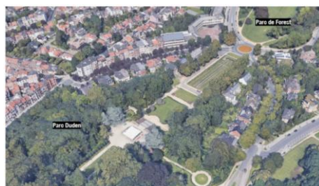
Vue aérienne du parc et de la localisation de la future guinguette.

La demande porte sur l'installation d'une guinguette provisoire dans le Parc Duden, entre le 1 er mai et le 30 septembre 2021. L'installation de cette guinguette se ferait sur une esplanade à la croisée de plusieurs chemins, en hauteur d'escaliers. Cette installation se composerait :