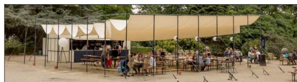
Vue de la guinguette installée lors d'une édition précédente. Image extraite du dossier.