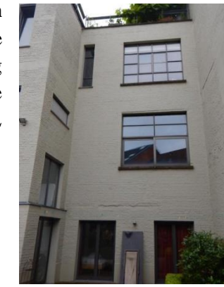
Westgevel ter hoogte van de nieuwe terrassen – foto uit aanvraagdossier