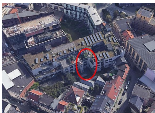
Westgevel met inplanting nieuwe terrassen

Het besluit van de Brusselse Hoofdstedelijke Regering van 28 juni 2001 schrijft de volgende delen van de voormalige gebouwen van L'Echo de la Bourse, gelegen Hopstraat 43-47 te Brussel, in op de bewaarlijst: de gevels en de daken, alsook bepaalde elementen van het interieur met name de lift en het trappenhuis van het gebouw van 1930 en de 19 e -eeuwse ateliers.