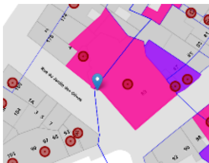
A gauche : Situation Brugis.

La Rue du jardin des Olives est comprise dans plusieurs zones de protection d'ensembles de maisons traditionnelles; l'implantation de l'urinoir juxta l'église Notre-Dame du Bon -Secours, classée par Arrêté Royal du 05/03/1936.