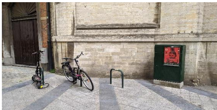
A gauche : implantation prévue de l'urinoir. A droite emplacement prévu de l'urinoir contre l'église Notre-Dame du Bon-Secours. Images extraites du dossier.