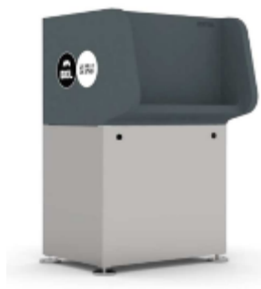
A droite : Modèle d'urinoir prévu. Illustration extraite du dossier de demande

La demande vise l'installation d'un urinoir contre l'église Notre-Dame du Bon-Secours, à la place d'un des 3 arceaux vélos : modèle Uritrottoir Pinte XL , aux couleurs de la Ville de Bruxelles. Il s'agit d'un dispositif de type « toilettes sèches » qui n'est pas relié au circuit des eaux usées. Un bac de paille permet de récolter l'urine et d'être réutilisée en engrais après compostage. Pour mémoire, lors de sa séance du 23/09/2020, la CRMS avait émis un avis sur le 'Plan Toilettes' par la Ville de Bruxelles.