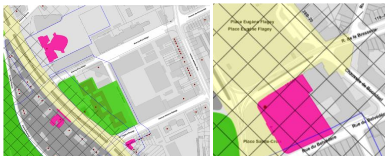
Implantation et zone de protection des biens classés du site Solbosch à gauche et de la place Flagey à droite, avec indication des ZICHEE et des espaces structurants

Cette demande de permis vise le renouvellement de la signalétique des campus ULB Solbosch et Flagey. Elle s'inscrit dans le renouvellement global de la signalétique sur l'ensemble des campus ULB en Région bruxelloise.