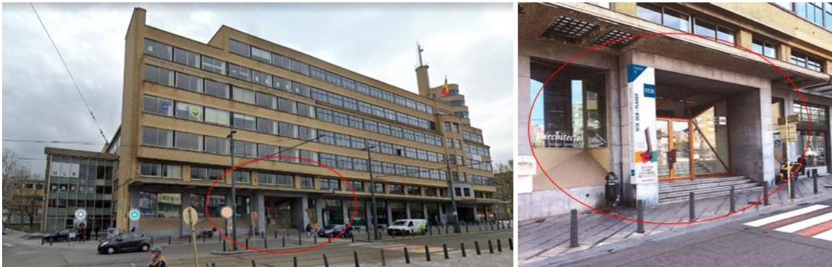
Façades mitoyennes de l'ULB à gauche et de l'INR à droite. Photomontage de la signalétique proposée pour l'entrée Flagey (document joint au dossier de permis)

La signalétique proposée pour le campus Flagey n'appelle pas de remarques d'ordre patrimonial hormis en ce qui concerne la balise institutionnelle proposée pour l'entrée donnant sur la place Flagey. Étant donné que cette façade s'inscrit en parfaite continuité avec la façade classée de l'ancien INR et que l'entrée forme le répondant de l'ancienne entrée du personnel de l'INR, ce dispositif, tel que proposé, introduirait un élément de rupture dans la composition d'ensemble des deux rez-de-chaussée et ne peut donc être approuvé sous sa forme actuelle. La CRMS demande de réétudier et de significativement réduire l'impact visuel de cette enseigne (ne pas prévoir de balise sur l'encadrement en pierre).