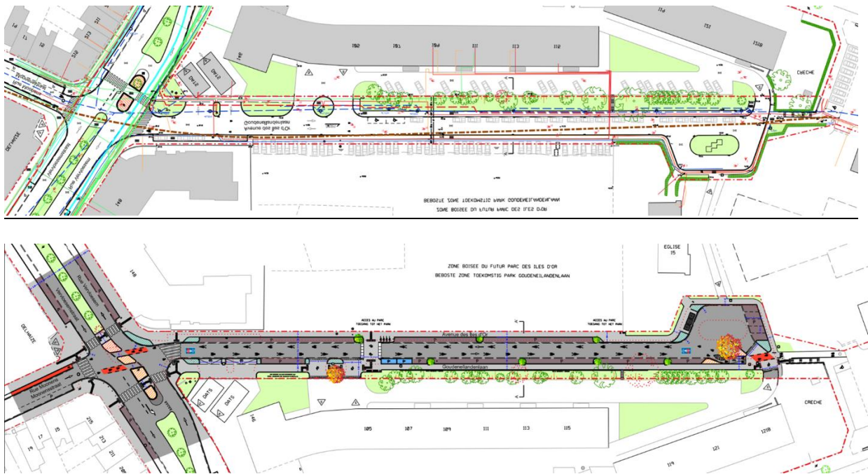
Situation existante (au-dessus) et projetée (en-dessous) – plans extraits du dossier de demande.

- le réaménagement des trottoirs qui seront revêtus de pavés porphyres; la voirie sera asphaltée avec des deux côtés des marquages peints au sol pour indiquer les pistes cyclables. Le réaménagement du côté sud implique la modification du profil du talus, la construction d'un muret de refend et l'abattage de certains arbres.