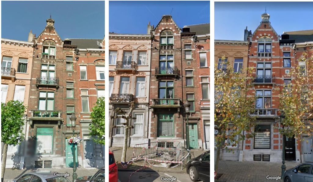
Façade avant : état de 2013, 2019 et 2021

La demande porte sur la mise en conformité d'infractions constatées par la Commune en date du 8/05/2020, suite à la rénovation de la maison en 2019-2020. Elle concerne la modification du nombre de logements, passé de 3 (situation de droit) à 4 ainsi que la modification de l'aspect architectural de la façade à rue, l'imperméabilisation de la cour, la construction d'un « auvent » en façade arrière et la réalisation de travaux structurels intérieurs, dont l'enlèvement de cheminées et l'ajout d'une trémie d'escalier au 3 e étage.