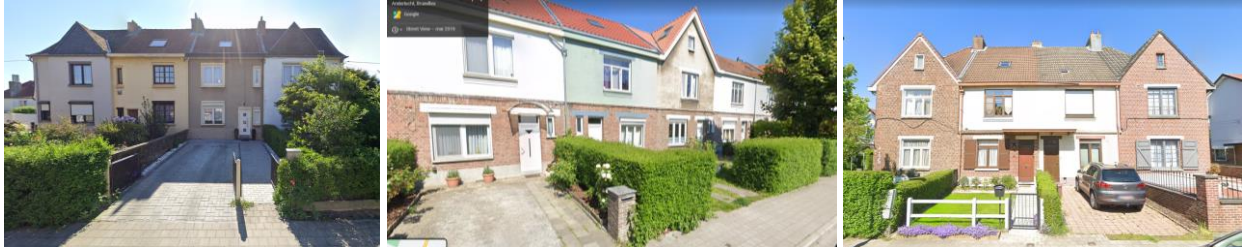
Vues de zones de recul transformées en stationnement dans l'avenue Guillaume Melckmans

Comme en témoignent les vues ci-dessus, la présente demande dépasse ce seul demandeur et devrait être traitée dans le contexte plus général de la cité-jardin La Roue. A ce jour, malheureusement, la cité-jardin ne fait toujours pas l'objet d'une vision d'ensemble, malgré les demandes répétées de la CRMS d'élaborer un outil réglementaire pour éclairer les demandes de travaux eu égard au contexte patrimonial environnant, tant au niveau du bâti que du site, incluant les zones de recul qui devraient faire l'objet d'un traitement paysager en accord avec le concept d'origine, sur base d'une étude historique et paysagère.