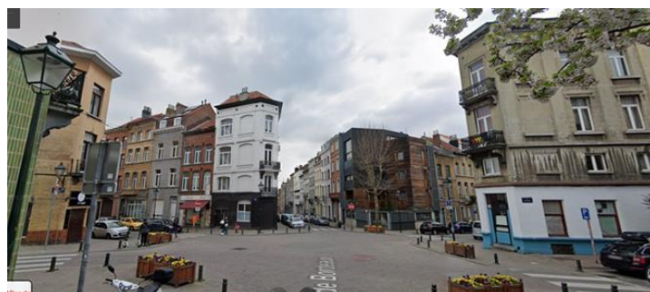
Implantation du bien et vue générale du carrefour