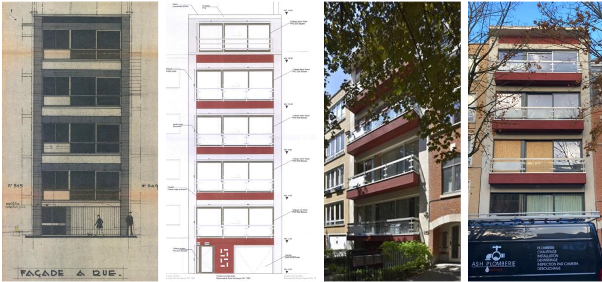
Elévations d'origine et projetée (extr. du dossier de demande) Vue de la façade il y a peu et vue actuelle

nouveaux châssis, par leur nouveau matériau, leur texture mate et leur ton foncé, entrent en dissonance avec les garde-corps métalliques encore en place. L'Assemblée regrette cette perte de cette cohérence de l'ensemble de l'immeuble.