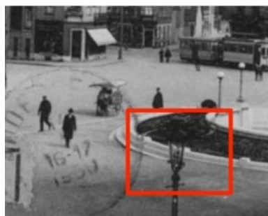
Fragment postkaart 1930 : geleidelijke overgang treden in pleinrelief