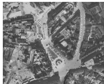
1977 © Bruciel