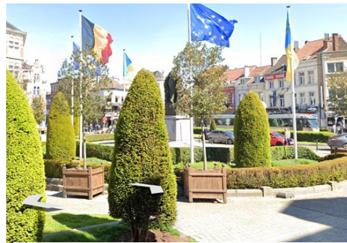
Huidige beplanting van de border