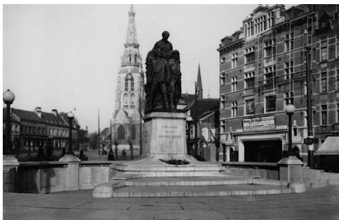
Postkaart 1922 (omstreeks de inhuldiging)