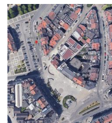
2021 © Google Earth