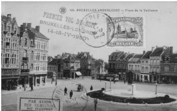
Postkaart jaren '30