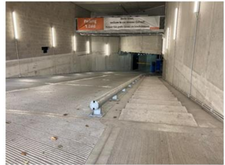
Referentie: APCOA Parking Nieuw Zuid Antwerpen

Zoals hierboven reeds vermeld, meent de Commissie dat de inrit van de parking in het huidige voorstel te veel impact zal hebben op de leesbaarheid van het monument en de zichten op en vanaf het beschermde monument. Daarnaast legt dit voorstel ook een zware hypotheek op het ‘toekomstig’ ontwerp van het (de zuidzijde) van het plein en kan de voorgestelde positie de nieuwe looplijnen hinderen die mogelijk gewenst zijn bij het herdenken van het plein (langs de zijde van de Wayezstraat/Dorpstraat). De KCML dringt er dus enerzijds op naar een minder ingrijpende oplossing te zoeken waarbij de in- en uitrit tot de parking de leesbaarheid van het monument zo min mogelijk aantast (zie punt 2) en waarbij de bovengrondse elementen van de parking daadwerkelijk en volgens een landschappelijke benadering geïntegreerd zijn in een globaal heraanlegproject voor het plein.