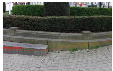
Bestaande toestand met aanduiding vermoedelijk oorspronkelijk niveau