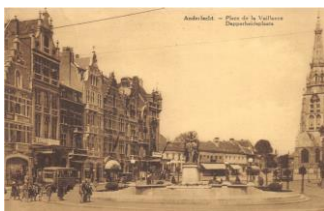
1935 – afb. uit het dossier

Opmerkelijk is de scenografische inpassing van het monument op het plein in een duidelijke compositie met de nieuwe gevels langs de westzijde van het Dapperheidplein (opgetrokken in neo-stijlen). Aan de zuidzijde van het plein werd een zichtas gecreëerd vanuit de toegangswegen (aangelegd 2e helft 19e eeuw) vanuit Brussel (Wayezstraat/Paul Jansonlaan) geflankeerd door de 'nieuwe' gevels en met op de achtergrond de imposante toren van de Sint-Guido kerk. Het monument kreeg een centrale plaats op het plein met links en rechts gelijkwaardige aanleg. De trappenpartijen en voetpad versterkten en onderlijnden de 'positie' van het monument op het plein. Deze situatie bestond tot de aanleg van de Metro in de jaren '70. Die werken brachten een verstoring van het stadweefsel met zich mee die vandaag nog merkbaar is langs de pleinrand ter plaatse van de Sint-Guidostraat (voor het administratief centrum) en rondom metrostation Sint-Guido. In het zog van de Metrowerken kreeg het plein zijn huidige disparate vorm. Het standbeeld, vanaf dan ingebed in het asymmetrische nieuwe plein met links gemotoriseerd verkeer en rechts een verkeersvrije zone, verloor hierdoor aan belevingswaarde en 'kracht'. Ook de gewijzigde niveaus en de gewijzigde (hogere) aanplantingen rondom het standbeeld zwakten ook de dialoog tussen het beeld en de pleinwanden af.