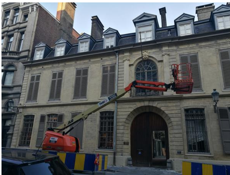
Vue de la façade à rue restaurée

Le bien a fait l'objet d'un permis avec avis de la CRMS pour les travaux relatifs à la restauration de la façade avant. Le permis a été délivré le 18/07/2017 et les travaux se sont terminés en février 2020.