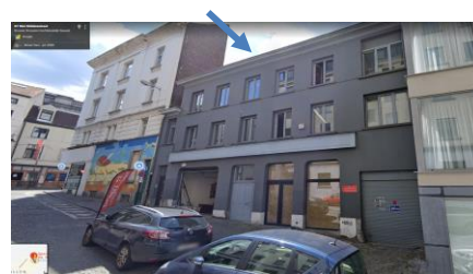
Rue Haute, 161-163 (au centre) et rue Saint-Ghislain, 69-73 (à droite)

Le bien situé rue Haute, 161-163 est un immeuble de 1862 de caractère néo-classique qui figure à l'inventaire du Patrimoine architectural de la Région de Bruxelles-Capitale. Il donne accès à une vaste bâtisse en intérieur d'îlot, construite en 1938 à usage de cinéma (jusqu'en 1964). Le bien sis rue Saint-Ghislain, 69-73 date d'avant 1932. La limite parcellaire jouxte la zone de protection de l'institut Diderot, classé, sis rue des Capucins, 58.