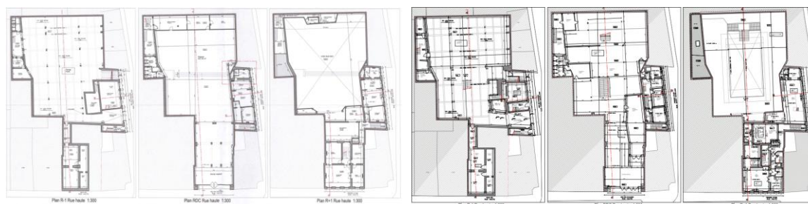
Plans -1, rez-de-chaussée et +1, avant et après interventions (extraits du dossier)