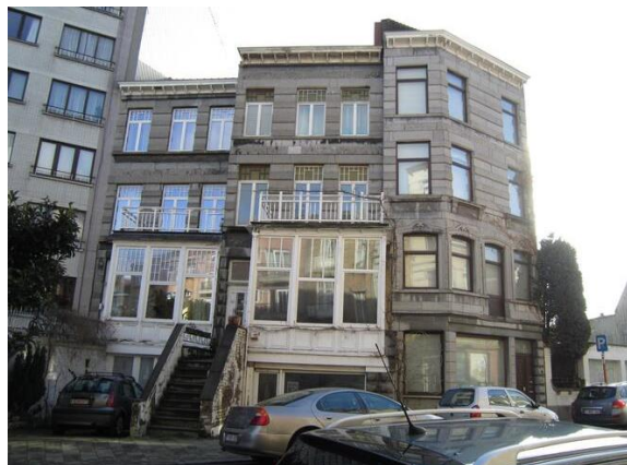
Rue Nestor De Tière 29, 31, 33

Le « manoir », une construction en briques isolée et implanté en retrait de l'alignement, date du 19 ème et est de style architectural teinté d'éclectisme. Une série de trois petits atelier/stockages, rudimentaires, ont été construits ultérieurement sur le même terrain, à l'alignement. Le « manoir » a été victime d'un important incendie en 2016.