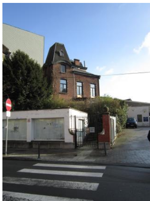
Rue Nestor De Tière 35-37

Le bien, dit le « manoir », qui fait l'objet de la demande, situé Rue Nestor De Tière 35-37 est inscrit à l'inventaire du patrimoine architectural, tout comme l'enfilade voisine de maisons bourgeoises aux façades en pierre bleue construites en 1913 par l'architecte T.A. Wiegierink aux n° 29, 31, 33 de la même rue.