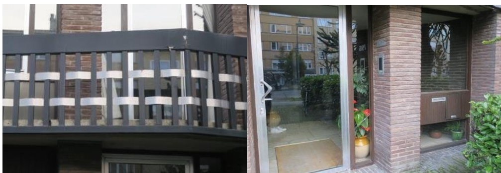
Photo des balcons en bois et acier entrelacé. Vue de l'entrée du rez-de-chaussée, jeu de vitres avec plein de briques brunes. Photo CRMS.