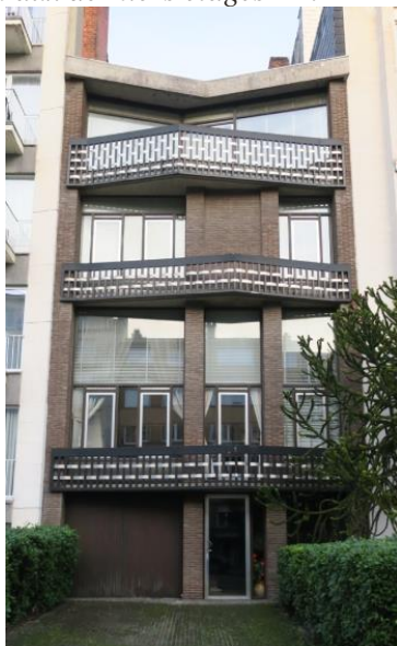
La maison Rombaut-Deplus œuvre d'André Jacqmain.

Intérieur. Plan ouvert organisé au départ d'un escalier en vis. Rez-de-chaussée occupé par un garage et des pièces de service; au premier: pièces de vie; en entresol: galerie en mezzanine, chambre à l'arrière; chambres et salles de bain aux derniers étages. » 1 .