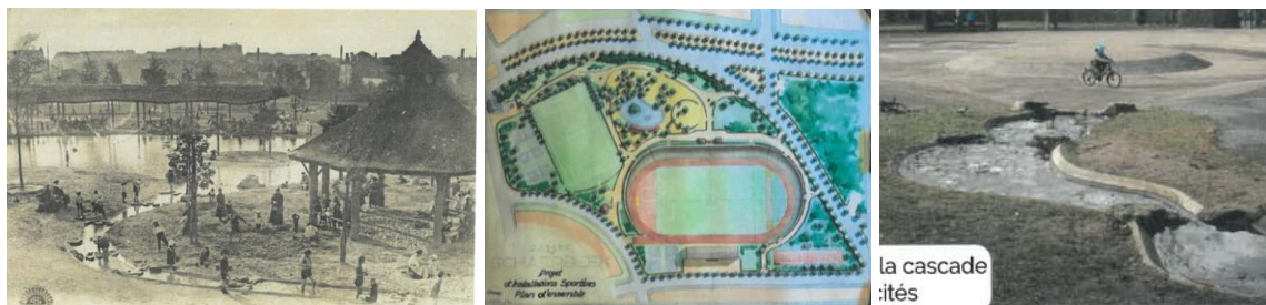
À gauche : Académie royale de Belgique (Collection Belfius), cachet postal 1914 ; centre : Commune de Schaerbeek, projet d'installations sportives. Plan d'ensemble s.d. [1947]. Archives communales de Schaerbeek, plan n° 18; Documents issus de l'étude historique jointe au dossier ; à droite : photo de l'état actuel issu de l'avant-projet.

La demande vise le réaménagement de la plaine de jeux qui occupe la partie centrale du parc de la Jeunesse. Situé en contrebas du boulevard Lambert, entre la chaussée de Haecht et l'avenue Louis Bertrand prolongée, celui-ci occupe la partie nord du parc Josaphat, aménagé dès 1904 et classé comme site par arrêté du 31/12/1974 . L'évolution historique et l'intérêt patrimonial du lieu sont détaillés dans l'étude très complète qui est jointe au dossier 1 .