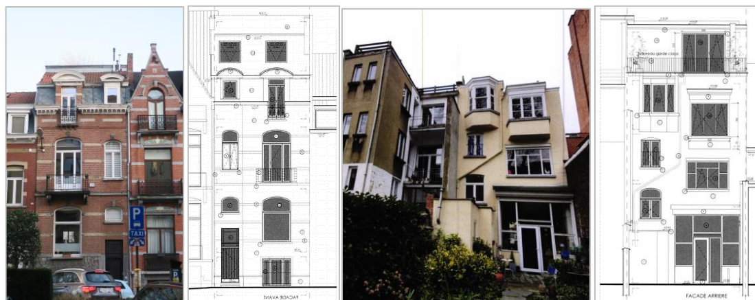
Plan d'implantation © Brugis et photo de l'enfilade concernée © Google Earth Photos et plans de la situation projetée des façades avant et arrière issues de la demande