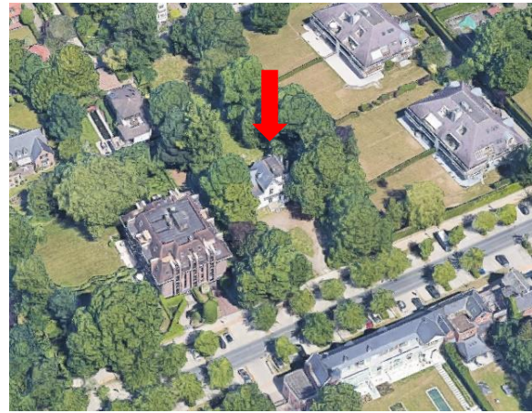
Vue aérienne de la parcelle

La rénovation inclut la démolition de la petite annexe à l'est et de la terrasse arrière, le changement de quelques fenêtres, une mise à jour des installations techniques (ventilation mécanique dans les espaces humides) et une modification de l'entrée.