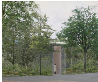
Photomontage du nouveau pavillon dans son contexte. Image tirée du dossier.