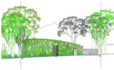
Élévation du nouveau pavillon depuis la rue. Image tirée du dossier.

La zone de recul devant la villa, une des caractéristiques essentielles de cette typologie, se verra profondément altérée par la construction du pavillon, perdant une qualité de composition et une perspective paysagère. Dans le jardin arrière de la villa, la proximité et le gabarit de la nouvelle résidence par rapport au bâtiment existant perturbera de manière importante la lisibilité de la façade arrière de la villa en occultant une partie.