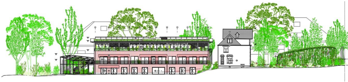
Élévation ouest des façades. Image tirée du dossier.