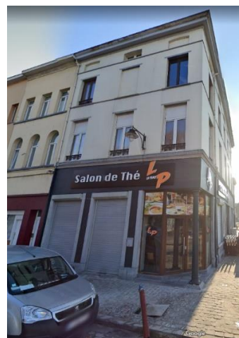
A gauche : Vue de l'immeuble en 2017