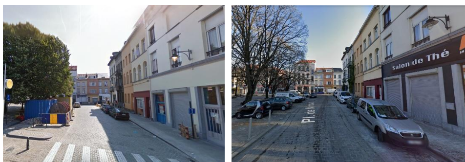
A gauche : Vue de l'alignement néoclassique de la place en 2017

La CRMS ne s'oppose pas au changement d'affectation du commerce en snack ni au principe de l'installation de terrasses en extérieur. Cependant, le bien étant inscrit dans un ensemble paysager néoclassique remarquable, la CRMS souhaite que cela s'organise dans le respect du patrimoine, ce qui n'est aujourd'hui plus le cas et non acceptable. La situation s'est fortement détériorée entre 2017 et aujourd'hui (voir photos supra) et les interventions commerciales (peinture « anthracite » du 1 er registre, enseigne, ...) ont altéré la typologie néoclassique de l'immeuble.