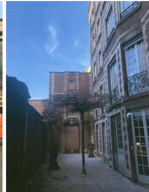
Vue actuelle de la façade arrière de la maison, vue depuis le dernier étage et vue de la cour (extr. du dossier de demande)

La demande porte sur les points suivants :