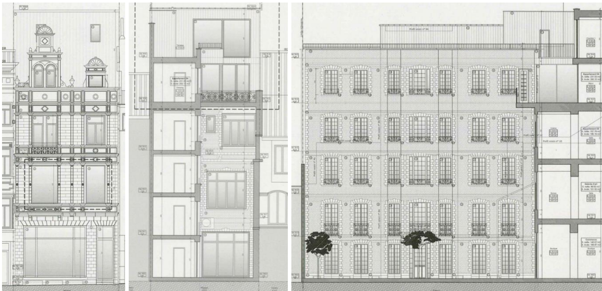
Élévations projetées : façade avant, façade arrière et façade latérale (annexe) (extr. du dossier de demande)