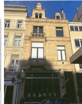
Plan de la maison et de son annexe en 1927 et vue actuelle et de la maison (extr. du dossier de demande)