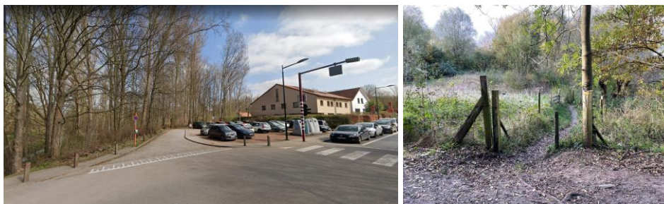
Plan d'implantation, projet et photos de la situation existante joints à la demande