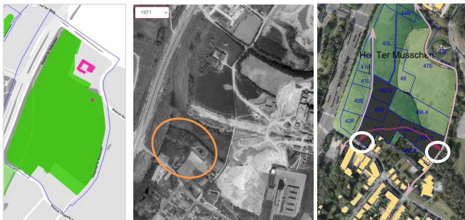
Localisation de la ferme et du site classés avec indication de la peupleraie © Brugis et images jointes à la demande

L'Hof ter Musschen compte parmi les plus anciennes fermes de la commune de Woluwe-Saint-Lambert. Classée comme monument par arrêté du 8/08/1988, la ferme en carré s'intègre dans un site en légère déclivité situé sur la rive est de la Woluwe, classé par arrêté du 9/06/1994.