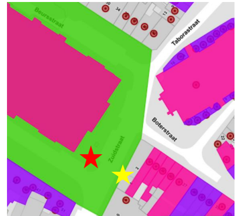
Gevraagde locatie in het rood en alternatief voorstel (te bestuderen) in het geel

. site 101: de voorziene camera op paal zou een storend element vormen in het beschermde landschap en ook de zichten op het beschermde Beursgebouw niet ten goede komen. Bovendien houdt de camera op paal geen rekening met de toekomstige herinrichting van de Beursite, die ook een nieuwe verlichting rond de Beurs omvat. De KCML aanvaardt de plaatsing van deze camera op paal dus niet en vraagt hem elders te plaatsen. Ze stelt in dat verband voor om de camera te plaatsen op de gevel van het pand aan de overzijde van de Zuidstraat (ongeveer ter hoogte van het nr. 4) .