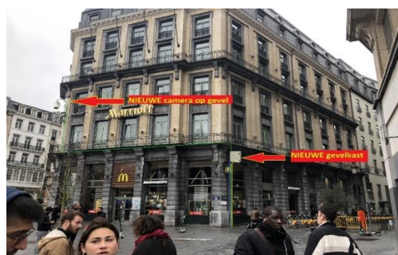
Fotomontage met de voorgestelde inplantingen - afbeeldingen uit het aanvraagdossier