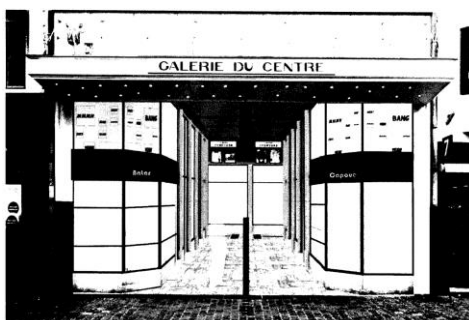
Situation projetée (extrait du dossier)