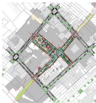
Situation projetée du futur parc. Image tirée du dossier de demande

La demande de permis d'urbanisme porte sur un îlot particulier formé par les rues Heyvaert, des Mégissiers, de Liverpool et du Chimiste, qui constitue un premier tronçon d'un projet de parc linéaire plus vaste, le Parc de la Sennette, reliant la Porte de Ninove au site des Abattoirs. Elle vise la démolition de bâtiments et l'aménagement d'une partie du parc en intérieur d'îlot. Les démolitions situées dans le bras du parc du côté de la rue de Liverpool font l'objet d'une autre demande de permis d'urbanisme pour laquelle la CRMS a émis un avis favorable lors de sa séance du 11 octobre 2021 3 . Le parc empruntera le tracé de l'ancienne Sennette entre la Rue de Liverpool et la Rue des Mégissiers. Deux entrées latérales à ce tracé sont créées vers la Rue Heyvaert et vers la Rue du Chimiste. Quatre entrées sont ainsi créées ; elles seront délimitées par des dispositifs de clôtures à structure en acier, avec remplissage en treillis métalliques.