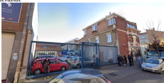
Situation existante Rue Heyvaert.