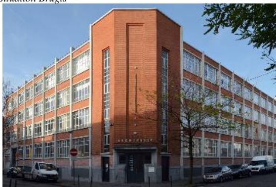
L'ancienne bonneterie Clérens.