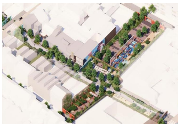
Photomontage du futur parc. Image tirée du dossier de demande