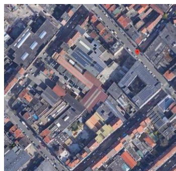
Vue aérienne de l'îlot