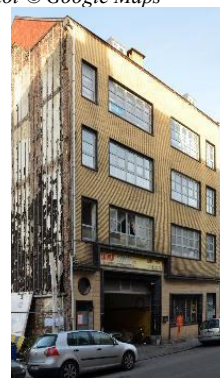
Les anciens établissements J.Algoet, Source : monument.heritage.brussels