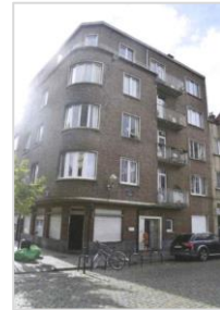
Implantation de l'immeuble et vue des façades