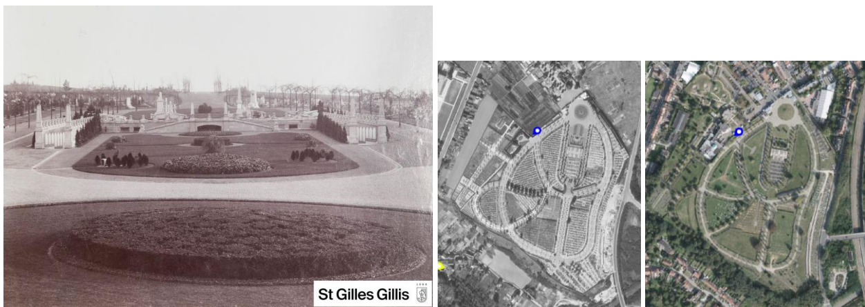
Vue générale du site début XXe s. et vues aériennes de 1944 et 2020