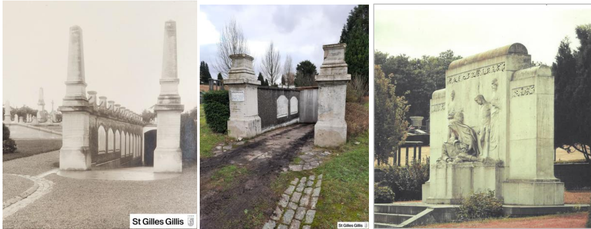
Entrée des galeries souterraines et Monument aux Morts