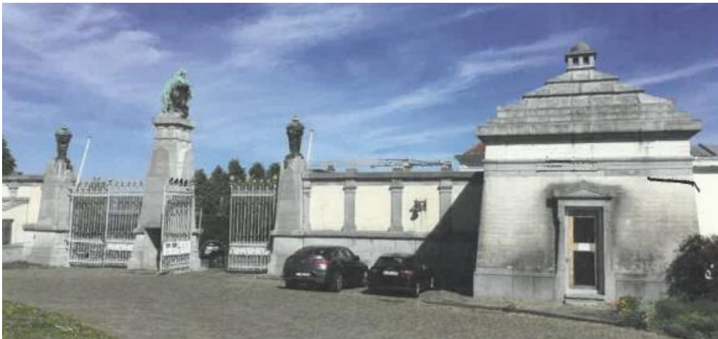
Entrée monumentale du cimetière (photo jointe au dossier)

La CRMS se prononce favorablement sur la proposition de classer comme monument l'entrée monumentale ainsi que les 18 monuments funéraires indiqués dans la demande, en raison de leur intérêt historique, artistique et esthétique. À cette occasion, elle encourage la Commune de Saint-Gilles à mener des recherches plus approfondies et à élaborer une réflexion globale sur le site du cimetière pour en faciliter la conservation et la gestion sur le moyen et le long terme.