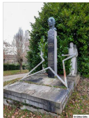
Sépulture des familles Smits-Mullier, sépulture de la famille Huart-Tegelbeckers tombe de J. Jacquemotte (photos issues de l'ouvrage Le silence et les tombes. Une histoire du cimetière de Saint-Gilles)

Tout en souscrivant à la mesure de classement proposée, la Commission propose à la Commune de Saint-Gilles d'entamer dès à présent une réflexion complémentaire envisageant tant l'architecture funéraire que les aspects paysagers du site. Ceci doit permettre de développer une approche globale et d'élaborer un véritable outil d'aide à la conservation et à la gestion de ce cimetière remarquable dans son ensemble. Ce travail pourrait se décliner en plusieurs volets :