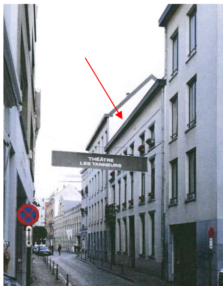
extrait du dossier