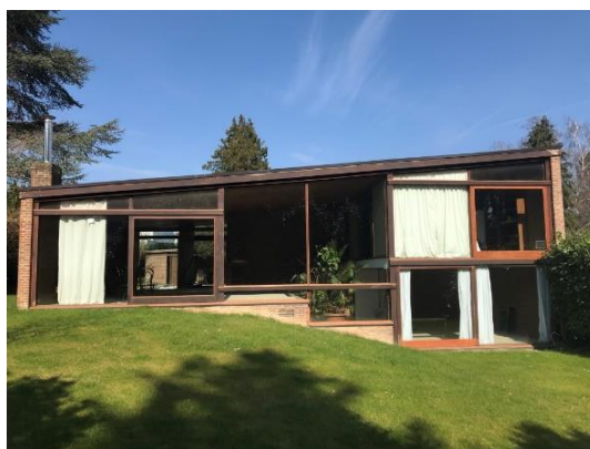
Façade avant de la maison, donnant sur le jardin principal.