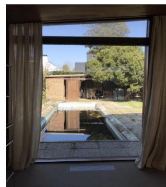
Vue sur la terrasse arrière.