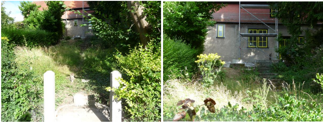
Situation existante (juillet 2022)

En raison de la pente assez importante du terrain à l'arrière de la maison, un mur de soutènement est projeté afin de reprendre les terres et éviter leur glissement lors de pluies importantes. Le nouveau muret est prévu en blocs de béton couverts de moellons de parement en pierre, sur une semelle de fondation en béton. Pour une facilité d'exécution, le conifère se trouvant sur le mitoyen des deux parcelles appartenant à la scrl Le Logis-Floral devrait être abattu et un arbre fruitier devrait être replanté dans les 10 mois de l'abattage. Des éléments restants des murets du jardin concerné par la présente demande sont en moellons mais ils se situent plus bas que le muret projeté.