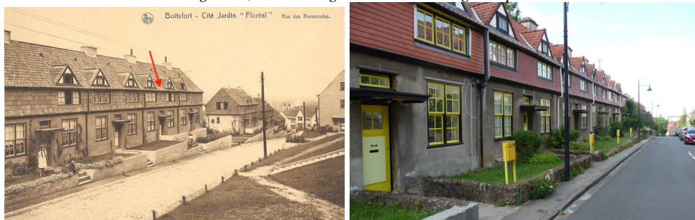
La rue des Renoncules autrefois et de nos jours