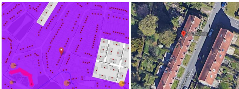
A gauche, extrait Brugis. A droite

En réponse à votre courrier du 08/07/2022, nous vous communiquons l'avis conforme défavorable émis par notre Assemblée en sa séance du 13/07/2022.