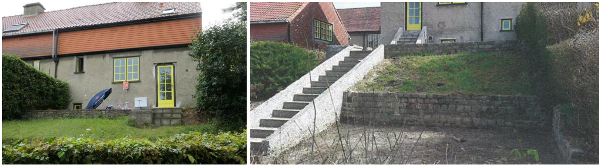
A gauche, situation actuelle du 6, rue des Renoncules. A droite, celle du 32, rue des Renoncules (muret en moellons sur deux niveaux) (extraits du dossier)

A l'arrière de la maison située au n° 38 de la rue des Renoncules, il s'agit de murets recouverts d'enduit à la tyrolienne. Côté rue, les murets sont réalisés en béton caverneux (en partie recouverts de plantations), tandis que côté venelle (limite des jardins arrière), ils sont réalisés en moellons.