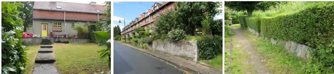
A gauche, situation actuelle du 38, rue des Renoncules. Au centre, vue du muret avant dans la rue des Renoncules. A droite, vue de la venelle latérale (extrait du dossier)

A l'arrière de la maison située au n° 38 de la rue des Renoncules, il s'agit de murets recouverts d'enduit à la tyrolienne. Côté rue, les murets sont réalisés en béton caverneux (en partie recouverts de plantations), tandis que côté venelle (limite des jardins arrière), ils sont réalisés en moellons.