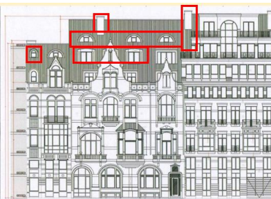
Situation de fait avec les modifications en toiture encadrées par la CRMS. Image tirée du dossier.