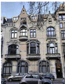
Vue actuelle de l'immeuble. Image tirée du dossier.