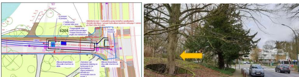
Détail de l'emplacement du sous-bassin 1 et vue de l'arbre remarquable répertorié 6204 (extraits du dossier)

Etant situés en sous-sol, les aménagements projetés ne seront quasiment pas visibles depuis la voie publique. Les taques d'accès vers les chambres de visite constitueront les seuls éléments en surface avec une armoire pour abriter l'installation électrique et le groupe hydraulique sur le trottoir (côté boulevard)