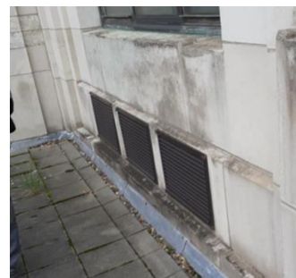
Localisatie vna de interventie, uitvoeringstekening en voorbeeld van een reeds bestaand rooster – documenten uit het aanvraagdossier

De KCML brengt een gunstig advies uit over de aanvraag. Ze vraagt de optie te weerhouden waarbij drie op elkaar aansluitende verluchttingsroosters in het gevelplan geïntegreerd worden aangezien dit een meer esthetische oplossing vormt dan de optie om een uit de gevel uitstekende uitblaasmond te plaatsen. Vanzelfsprekend moet de gevelopening zorgvuldig uitgevoerd worden zonder de omliggende delen te beschadigen en onder toezicht van de DPC.