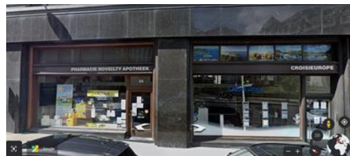
Exemple d'enseignes parallèles existantes

Le rez-de-chaussée commercial de l'immeuble présente une remarquable unité stylistique avec son parement en granit noir lisse (type Labrador) très caractéristique de cet immeuble Art déco et bien préservé. Les enseignes parallèles existantes sont discrètes et perturbent peu la lisibilité du rez-de-chaussée, de teinte foncée, puisqu'elles sont conçues en lettres blanches sur fond noir, non lumineuses et intégrées dans la traverse qui sépare les vitrines de leur imposte.