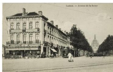
Angle du côté opposé de l'avenue de la Reine en 1920 (coll. Belfius) et aujourd'hui (StreetView)

L'angle en vis-à-vis a été construit au moment de la première urbanisation de l'avenue de la Reine, au début du XX ème siècle. L'immeuble néoclassique a ensuite été démoli pour faire place à un immeuble résidentiel construit à l'occasion de l'Expo'58, selon un nouvel alignement courbe.