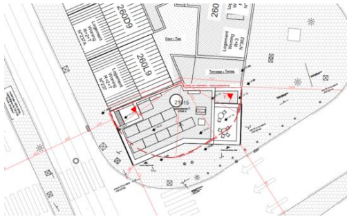
Implantation (en rouge le nouvel alignement 'courbe' – extr. du dossier de demande)

partie de la nouvelle parcelle d'angle et ne suit pas le tracé courbe. Le rez-de-chaussée du nouvel immeuble comprend des fonctions collectives (hall, local poubelles, local vélos, compteurs, etc) ainsi qu'un parking public pour vélos. Aux étages sont prévus cinq logements, avec salle collective et terrasse commune au dernier étage, du côté de la rue des Palais Outre-Ponts.