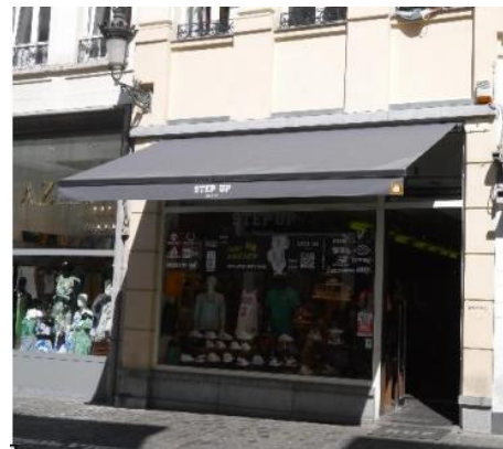
Photo de la devanture avec son auvent actuel. Aout 2022