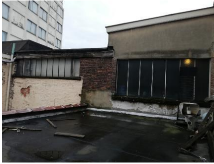
Photo de l'état actuel du mur du pignon. Image tirée du dossier.