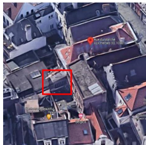
Vue Google Earth© avec en rouge la localisation du pignon concerné