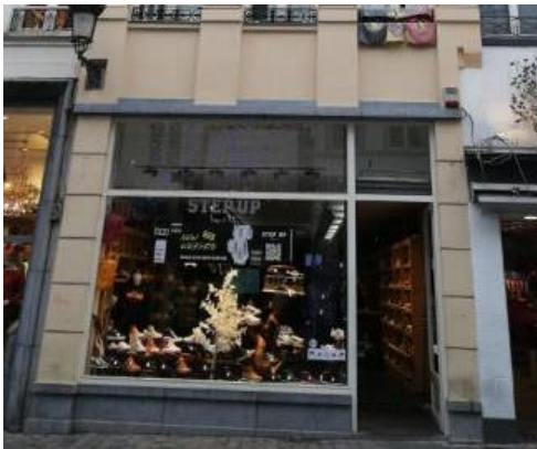
Photo de la devanture sans auvent. Image extraite du dossier

Cependant, il a été constaté récemment qu'une seconde tente solaire a déjà été placée, et que cette dernière n'a pas été placée conformément aux plans introduits. Des nouveaux trous ont été faits dans les pierres de la façade au niveau des bossages, au-dessus des trous de la première tente solaire qui avait déjà été placée en infraction.