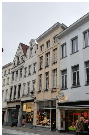
Vue du bien en façade avant. Image tirée du dossier