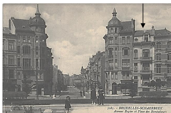
Bâtiments d'angle à l'articulation de la place avec l'avenue Rogier

Celle-ci appartient à un front bâti cohérent, dont le style oscille entre l'Art Nouveau et l'éclectisme, et bénéficie d'une grande visibilité grâce au recul offert par l'espace vert qui la précède. Mitoyenne à l'un des deux immeubles qui monumentalisent l'articulation de la place avec l'avenue Rogier (arch. M. Dechamps), la maison participe pleinement à la composition urbaine du lieu, ayant en grande partie conservé sa cohérence depuis son urbanisation au début du XXème siècle.