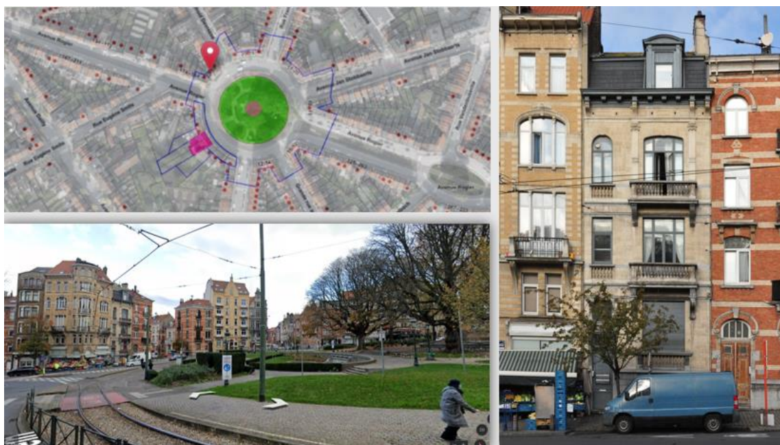
Implantation du bien © Brugis et © Streetview et état existant de la façade © Urban.brussels

Ce projet concerne une maison de style éclectique située 31 place des Bienfaiteurs, réalisée en 1911 selon les plans des architectes A. Struyven-Gilson et J. Gilson. Elle est comprise dans la zone de protection du monument aux Bienfaiteurs, classé avec ses abords comme monument et comme site par arrêté du 10/07/2008 (monument dû au sculpteur G. Devreese et l'architecte H. Jacobs, square aménagé par le paysagiste E. Galoppin). Le bien est inscrit à l'Inventaire du patrimoine architectural.