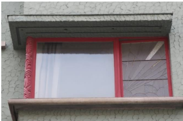
Détail des fenêtres du 1 er étage en façade avant.