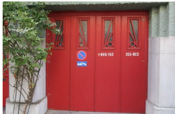
Détail de la porte de garage en façade avant.