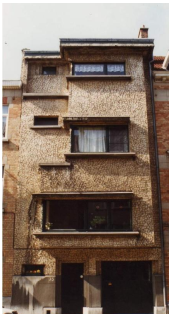
Etat de la façade avant en 1994.