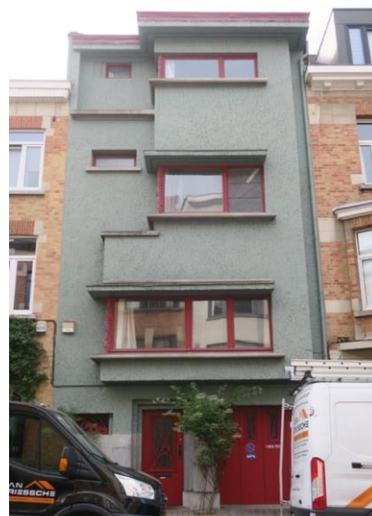
Etat de la façade avant en Octobre 2022.