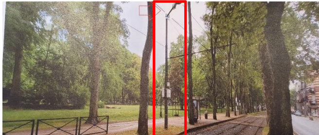
Localisation projetée de la caméra 1 à hauteur de l'avenue du Panthéon, 9 (extrait de la demande)

Le poteau étant déjà installé, l'impact visuel de la nouvelle caméra serait très faible. D'après le visuel, celle-ci semble être orientée de manière à couvrir les voies de tram. La CRMS n'émet pas d'objection à l'installation de la caméra 1 qui se situe en dehors de l'emprise du site classé.