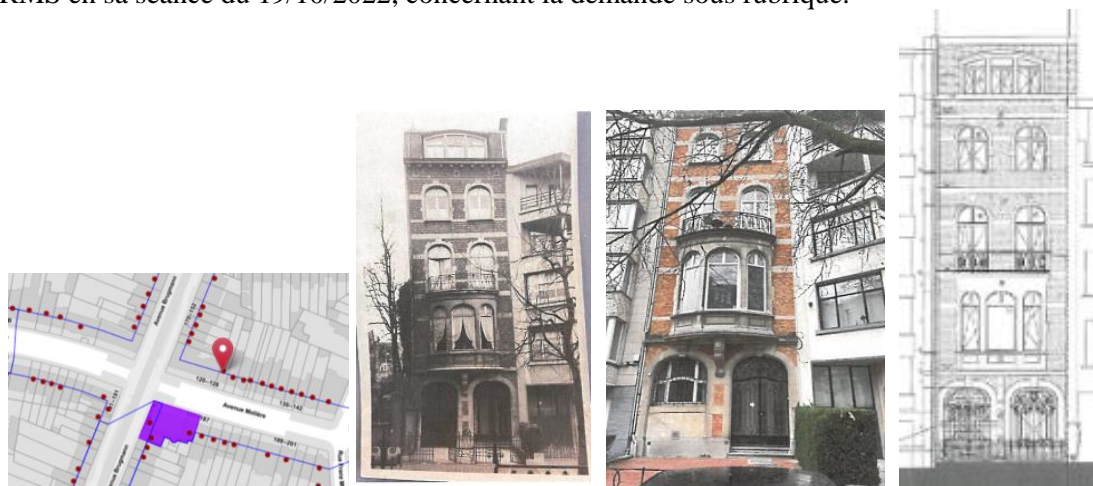
A gauche, extrait Brugis. Au centre gauche, photo ancienne avec la porte de garage d'origine (non datée). A droite, situation actuelle et projetée (extraits du dossier)

En réponse à votre courrier du 3/10/2022, reçu le 7/10/2022, nous vous communiquons l'avis émis par la CRMS en sa séance du 19/10/2022, concernant la demande sous rubrique.