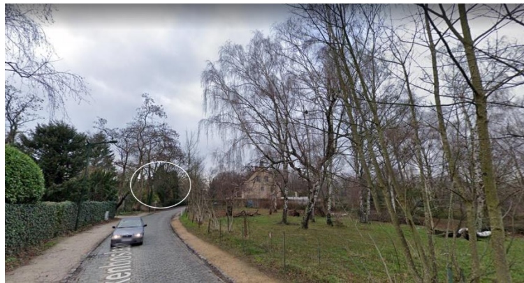
Vue sur la parcelle concernée, Kauwberg en avant-plan

La CRMS rend un avis défavorable sur le projet de lotissement. Compte tenu du contexte paysager sensible de la parcelle, elle s'oppose à la surdensification et à la réorganisation du terrain, en particulier à la minéralisation envisagée de la zone de recul qui longe l'avenue, qui seraient préjudiciables aux perspectives vers et depuis le site classé du Kauwberg, dont la zone de protection englobe la parcelle concernée.