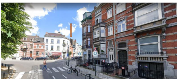
Vue depuis le square Marguerite sur la façade concernée