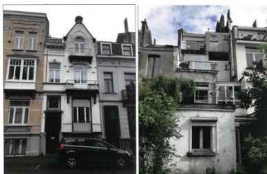
Façades à rue et arrière (documents joints à la demande)