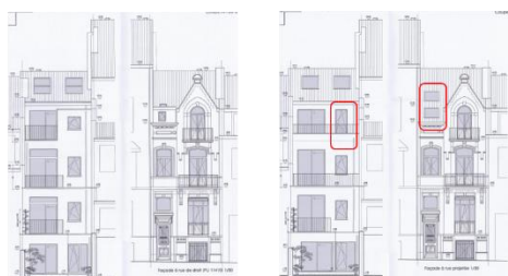
Modifications envisagées par rapport à la situation de droit (documents joints à la demande)