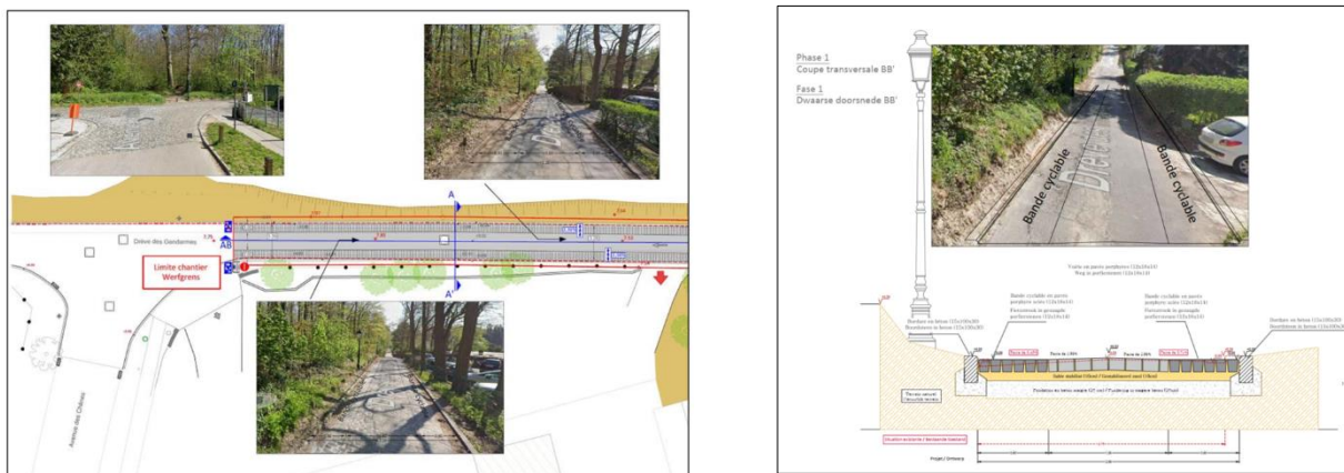
Projet – documents extraits du dossier de demande

La demande comprend enfin un document renseignant le type de mobilier urbain qui sera utilisé.