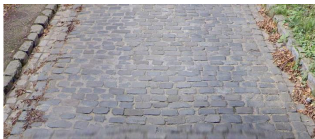
Détail du tronçon rénové en 2005